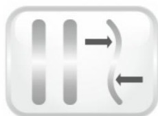
Kovové tvarovatelné výztuhy