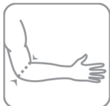
Měřeno přes loket