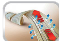
Elastická tkanina (prodyšná)