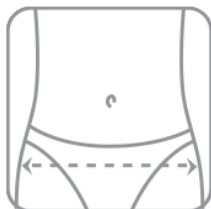
Měří se přes kyčle