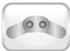
Dvě kovové kloubové výztuhy