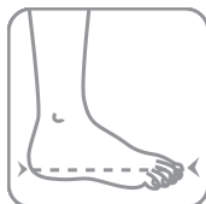
Odpovídá velikosti bot