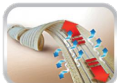
Elastická tkanina (prodyšná)