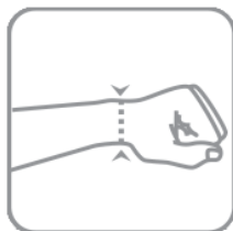
Měreno přes zápěstí